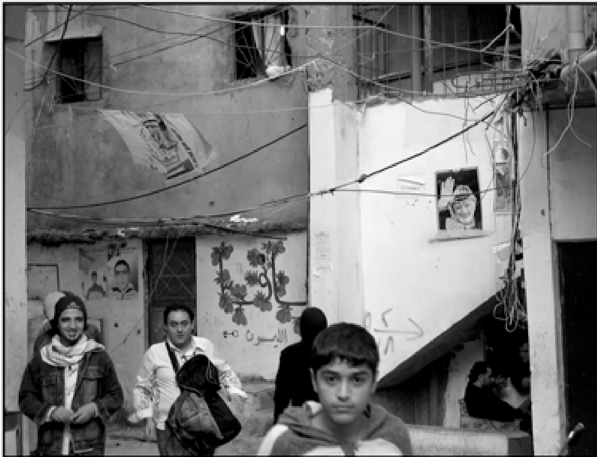
DANS LES RUES DE CHATILA

1978 à 2000). De l'ordre de 5 000 personnes, dont 400 à 600 femmes, résistants libanais ou palestiniens mêlés, y ont été emprisonnées et torturées sans distinction de sexe. Une prison hors la Loi, où les conventions de Genève n'étaient bien évidemment pas appliquées et à laquelle les représentants de la Croix Rouge Internationale n'ont pu