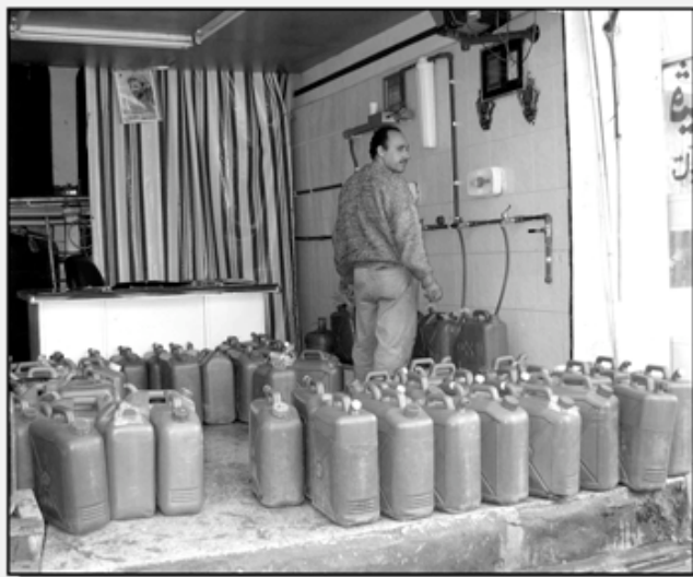
UNE STATION DE TRAITEMENT DES EAUX

au rôle que la Syrie continue de jouer au Liban. Tout en souhaitant une redéfinition des rapports syro-libanais et une évolution du système politique libanais dans un sens plus démocratique, ces élus s'inquiétaient de voir la France se rallier à une résolution d'inspiration américaine, véritable ingérence dans les affaires libanaises qui, pour eux, s'inscrit dans le projet de "Grand Moyen Orient" défendu par Bush et qui sert de base idéologique à l'intervention US en Irak.