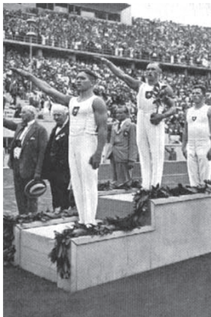
LES J.O , UN GRAND MOMENT FRATERNEL (EN 1936)