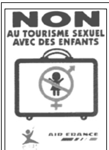
Air France fait campagne contre le tourisme sexuel (s'il concerne des enfants). Quant aux adultes ...